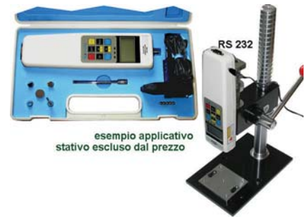
esempio applicativo stativo escluso dal prezzo